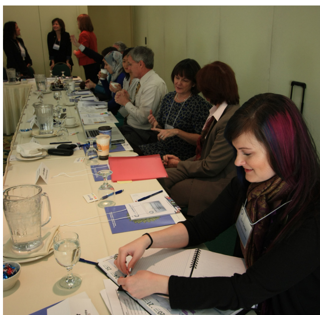
Participants du forum des partenaires, 19 novembre 2012, Ottawa

« Les renseignements fournis m'ont permis de constater l'ensemble des ressources disponibles. Il y en a bien plus que je pensais! » - représentant partenaire